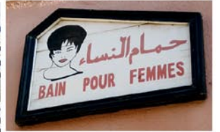
photographie par Rachel Stella Jenkins. Maroc Nov 2008.