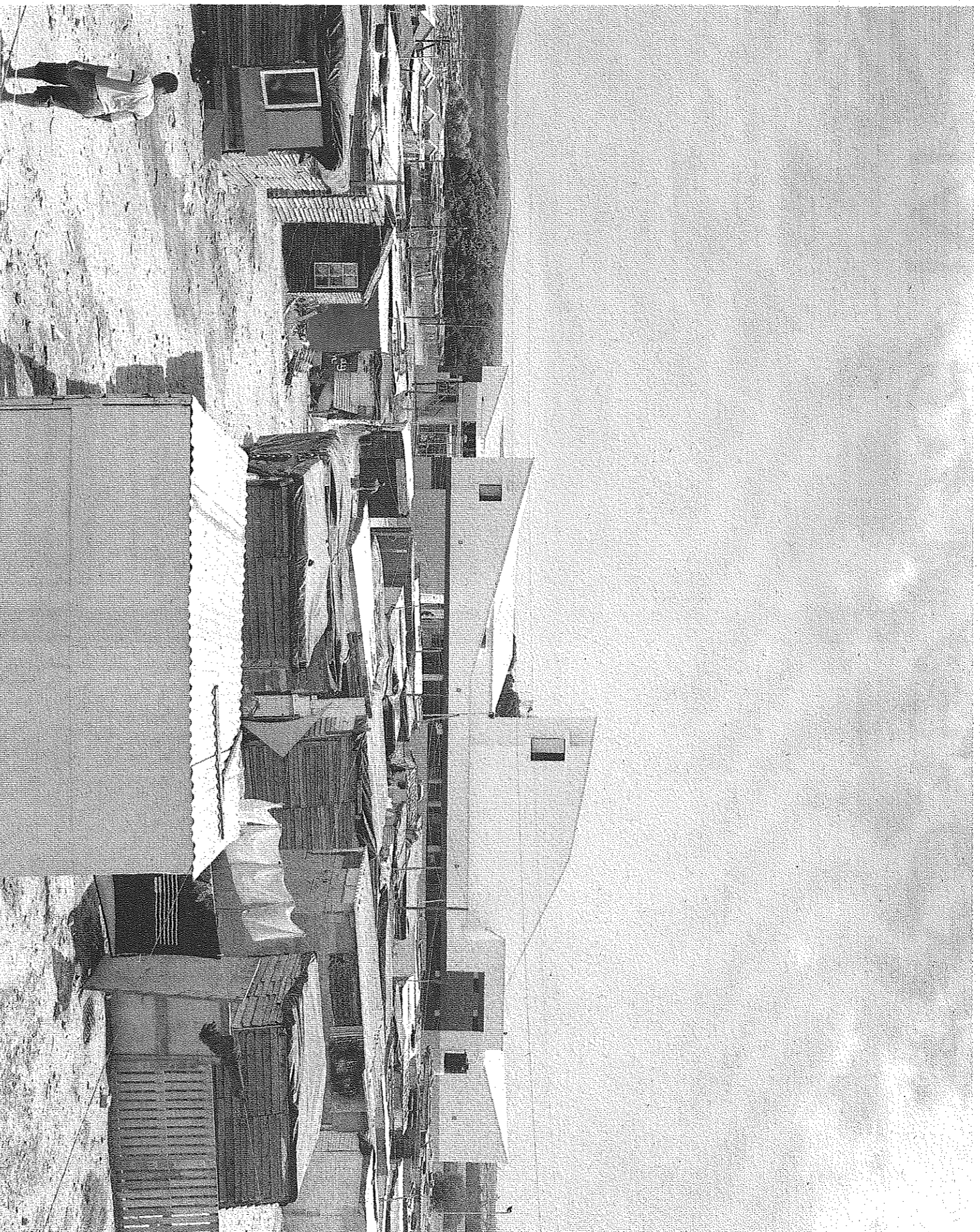
Inkwenkwezi-school in Kaapstad, Zuid-Afrika. Architect: Bureau Noero Wolff.

voegt daar een Afrikaanse identiteit aan toe. De school die hij in Kaapstad bouwde is een witte geometrische sculptuur die toch volkomen vanzelfsprekend tussen de provisorisch gebouwde huizen in een sloppenwijk staat. Het stragge gebouw krijgt iets gewoons door de gekleurde banen op de gevel, een abstracte versie van de typisch Afrikaanse muurschilderingen.